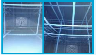
TEMİZLENMİŞ VE KAPLANMIŞ DEPO

Talep Olursa Sisteminizi Susuz Bırakmamak İçin Rezerv Depo ve Tanker Sağlıyoruz.