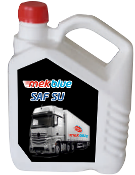
mekblue SAF SU