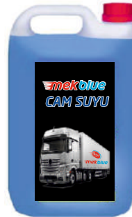
mekblue CAM SUYU